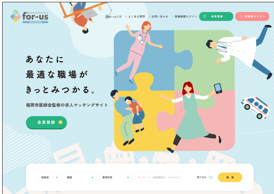
「for-us」サイト（ https://for-us.co.jp ）

当レポート発行日現在、求人情報掲載数は301件、求職者の累計登録は208名、マッチング（求人への応募）は44件、面接を経て採用に至った実績は5件である。